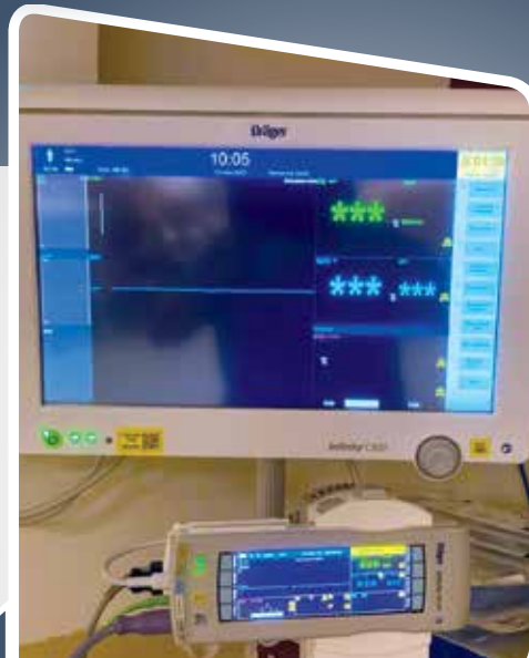
Moniteur physiologique pour le bloc opératoire