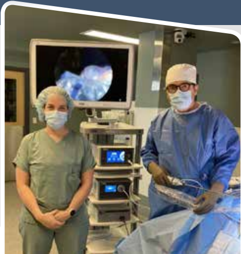
Système vidéo haute définition, table opératoire et instruments chirurgicaux pour le département de la gynécologie