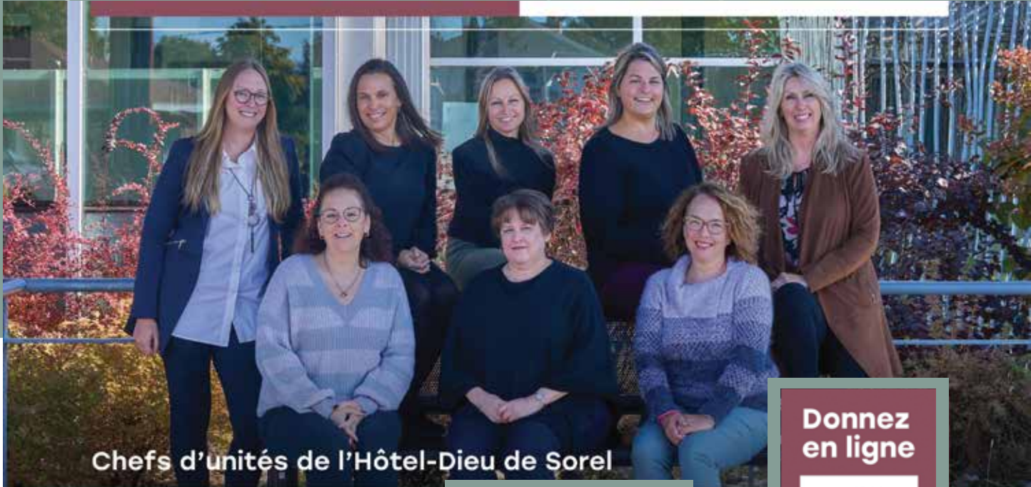
Chefs d'unités de l'Hôtel-Dieu de Sorel