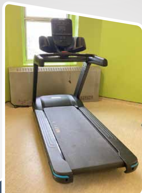
Tapis roulant pour le département de la psychiatrie de l'Hôtel-Dieu de Sorel