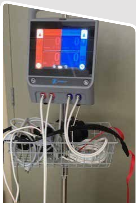
Garrot pour le département de l'orthopédie